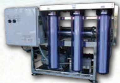
小型海水淡水化装置 MYZ E-250