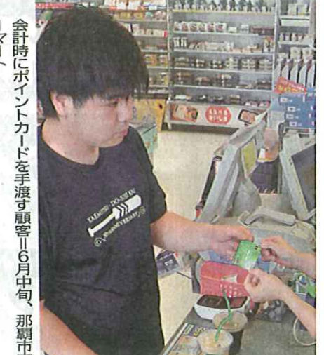
会計時にポイントカードを手渡す顧客は6月中旬、那覇市内のファミリーマート